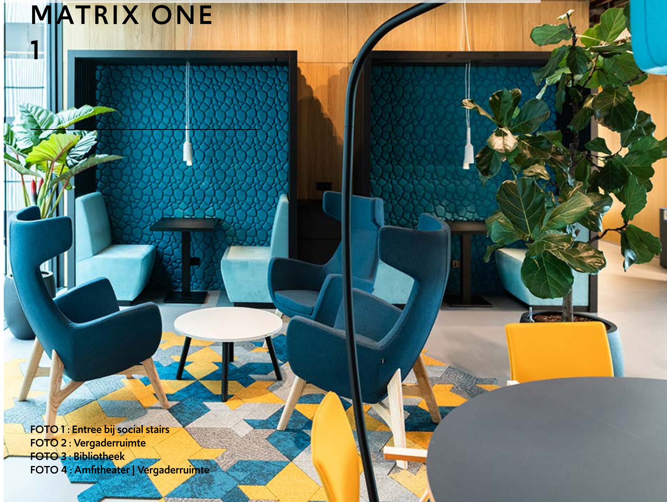
FOTO 1 : Entree bij social stairs FOTO 2 : Vergaderruimte FOTO 3 : Bibliotheek FOTO 4 : Amfitheater | Vergaderruimte