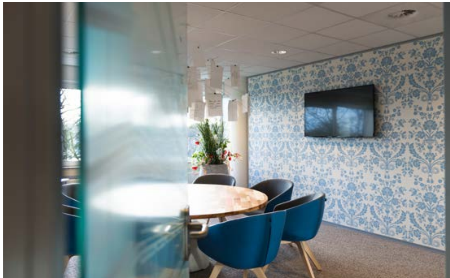
FOTO 3: Identiteit op glaswand